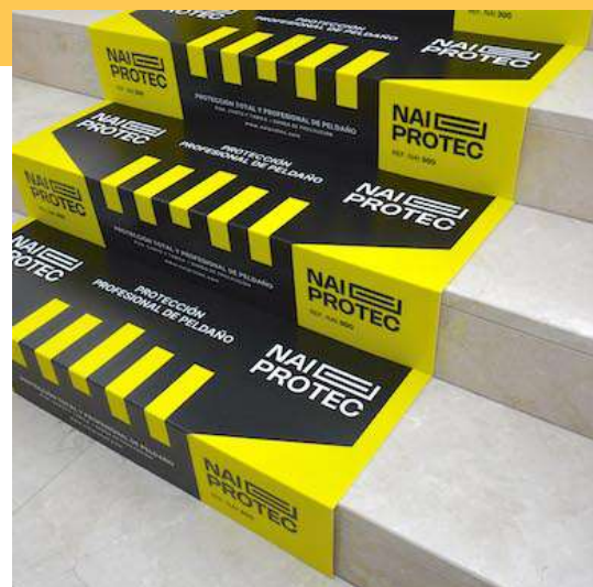
INSTALACIÓN CON TIRAS ADHESIVAS DE DOBLE CARA

INSTALACIÓN: Se recomienda limpiar perfectamente la superficie a proteger, antes de instalar la protección del peldaño para que el sistema elegido se fije correctamente.