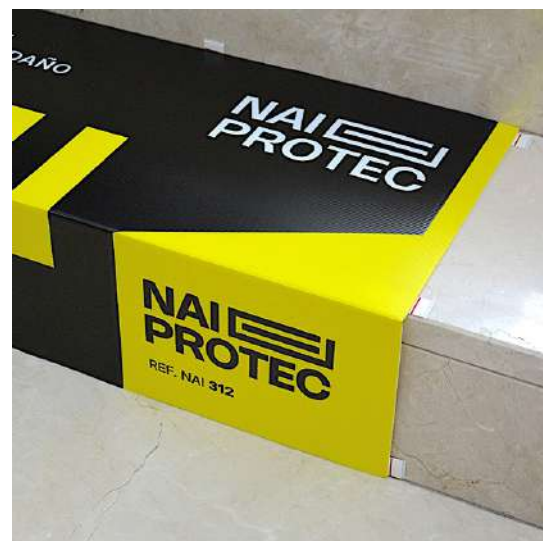
INSTALACIÓN CON ROLLOS DE CINTA ADHESIVA

Naiprotec no se hace responsable de los daños y perjuicios consiguientes como resultado del mal uso de este producto.